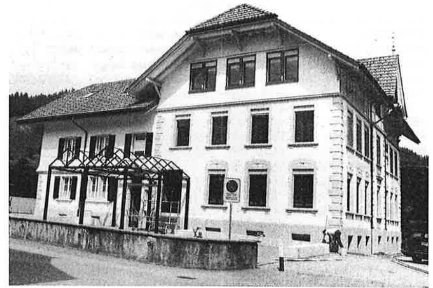
Das Schulhaus heute.

14. März 1950 «Es wird beschlossen, das Klavier, das Herrn Güdel gehört, um 350 Franken zu erwerben.»