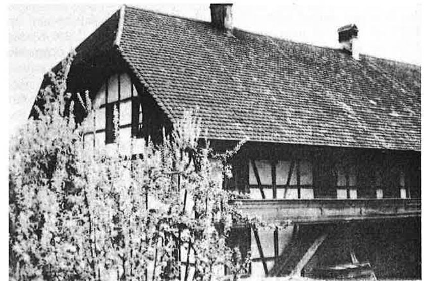
Die Kashiütte, in deren Obergeschoss von 1893 bis 1903 die Unterschule eingemietet war.