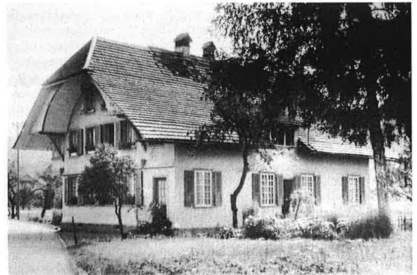
Das alte Schulhaus zu Moos um 1960.

Am 14. Juli 1890 beklagte sich Jungfer Knutti (1882 an die Unterschule gewählt) wieder, «sie habe ihren 74 Schülern nicht genügend Platz; die Schulkommission findet, dass ihre Klage leider begründet ist. Weil das ein erstes Erfordernis zum Gedeihen der Schule ist, dass jedem Schüler ein genügendes Flächenmass Raum