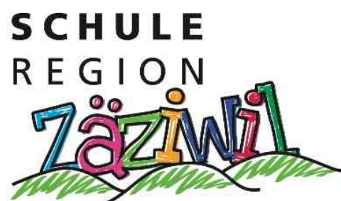
Früheres und neues Logo der Zäzi Schule resp. Schule Region Zäziwil